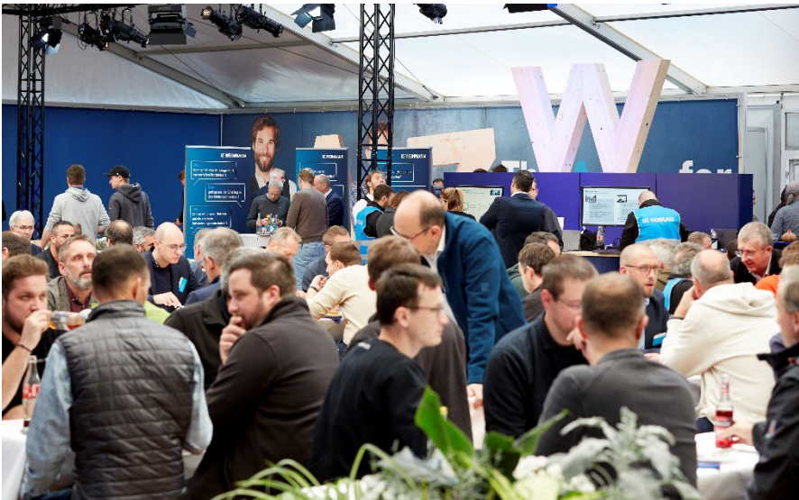
Bild 3: Der persönliche Austausch stand auch in diesem Jahr im Mittelpunkt.