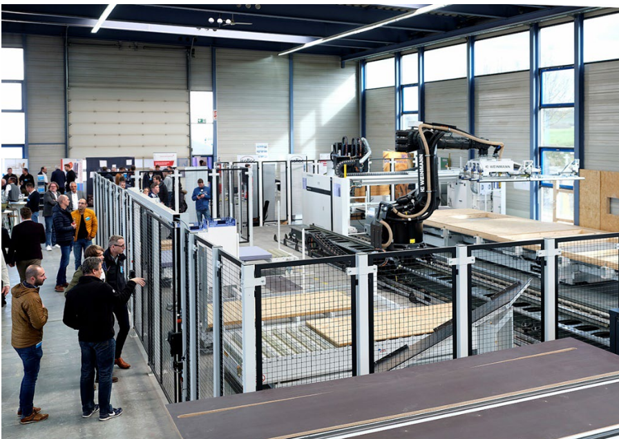
Bild 4: Ein technisches Highlight, das viele Blicke auf sich zog, die Fertigungszelle für autonomes Plattenauflegen mit Roboter.

WEINMANN Treff Event Video: WEINMANN Treff 2022 - YouTube